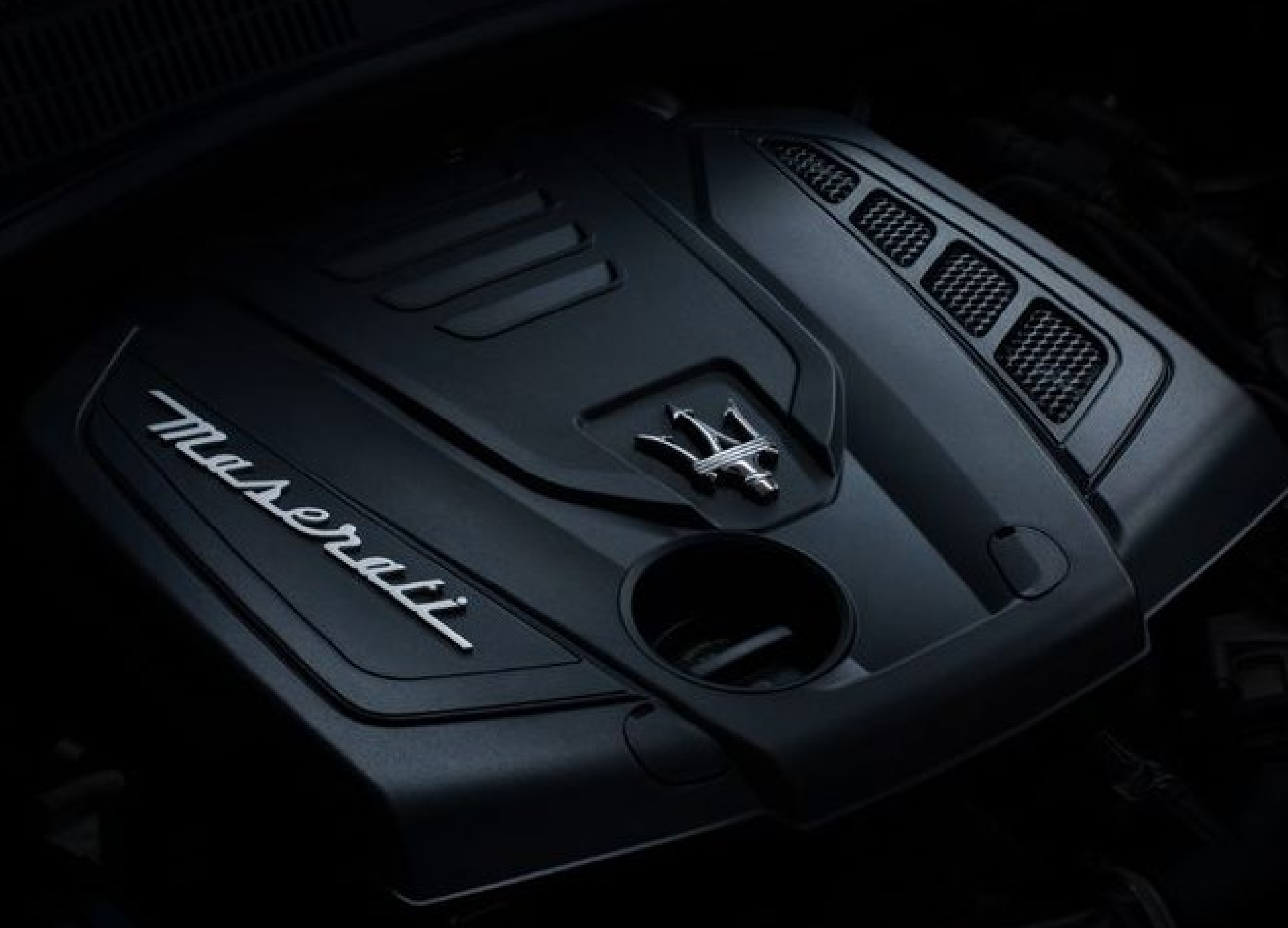
عندما تصبح هذه البيانات نهائية سوف تتوفر على موقع مازيراتي الإلكتروني ولدى وكلاء مازيراتي الرسميين.