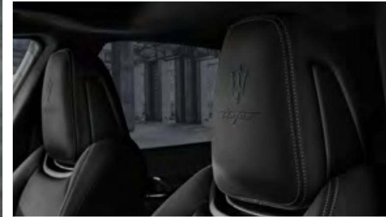
كواترو بورتية تروفيو - تفاصيل مسند الرأس