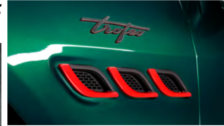
كواترو بورتية تروفيو - فتحات تهوية جانبية وشعار تروفيو