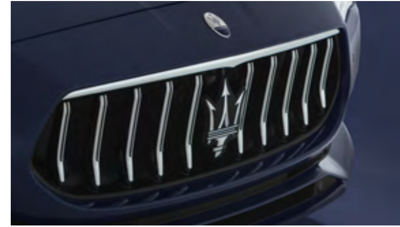
كواتروبرتيه - الشبكة الأمامية