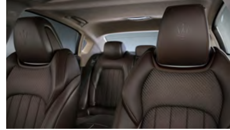
كواتروبرتيه - تفاصيل مسند الرأس