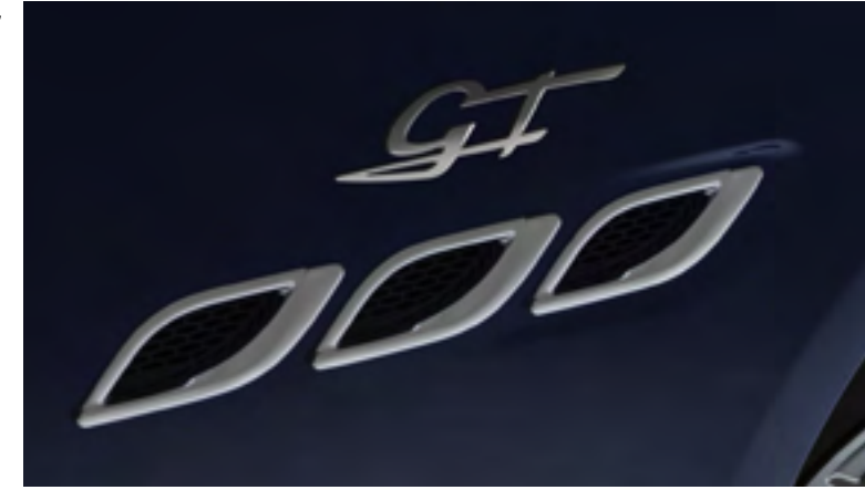
كواتروبرتيه - فتحات تهوية جانبية وشعار GT