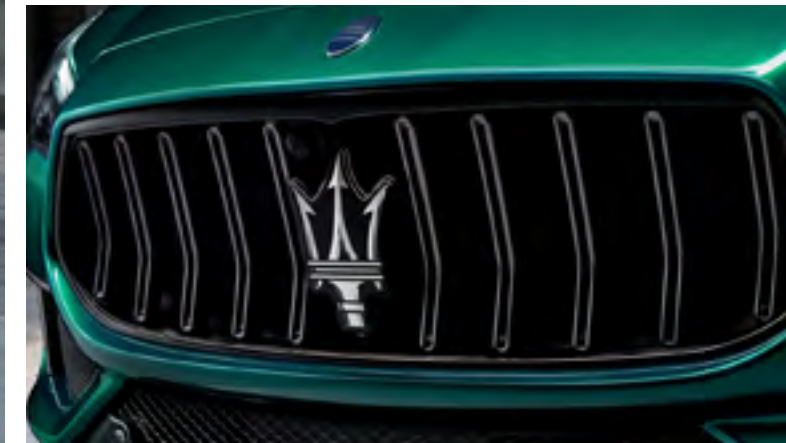
كواترو بورتية تروفيو - الشبكة