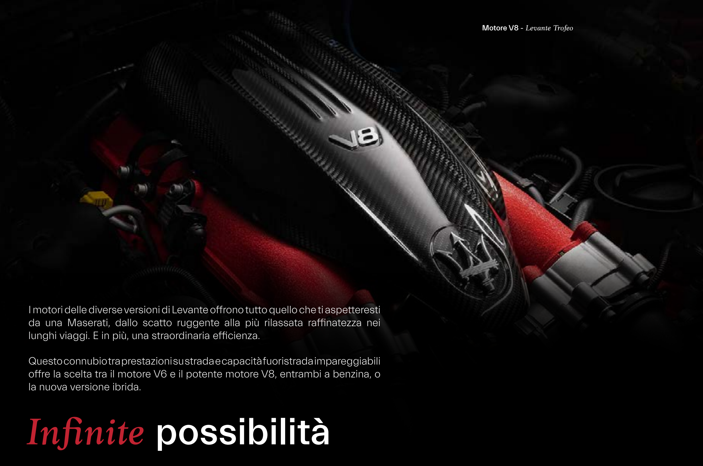
Motore V8 - Levante Trofeo

I motori delle diverse versioni di Levante offrono tutto quello che ti aspetteresti da una Maserati, dallo scatto ruggente alla più rilassata raffinatezza nei lunghi viaggi. E in più, una straordinaria efficienza.