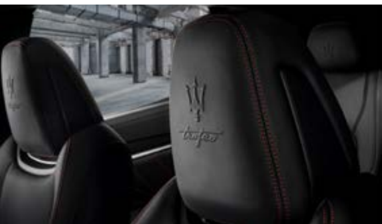
Levante Trofeo - Dettagli Poggiatesta