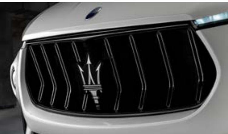
Levante Trofeo - Calandra