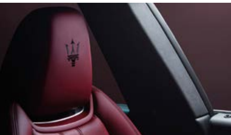
Levante - Dettagli Poggiatesta