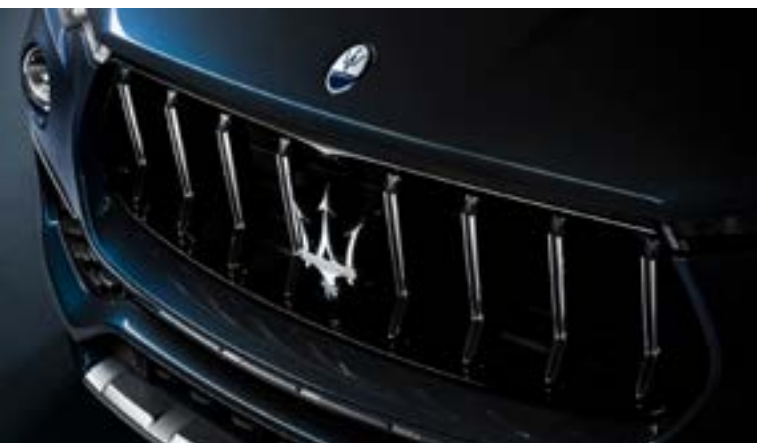
Levante GT Hybrid - Calandra