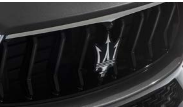
Levante - Calandra