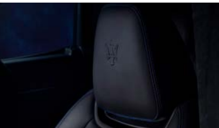
Levante GT Hybrid - Dettagli dei poggiatesta