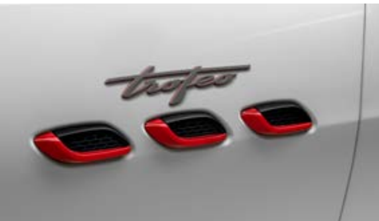
Levante Trofeo - Prese d'aria laterali e stemma Trofeo