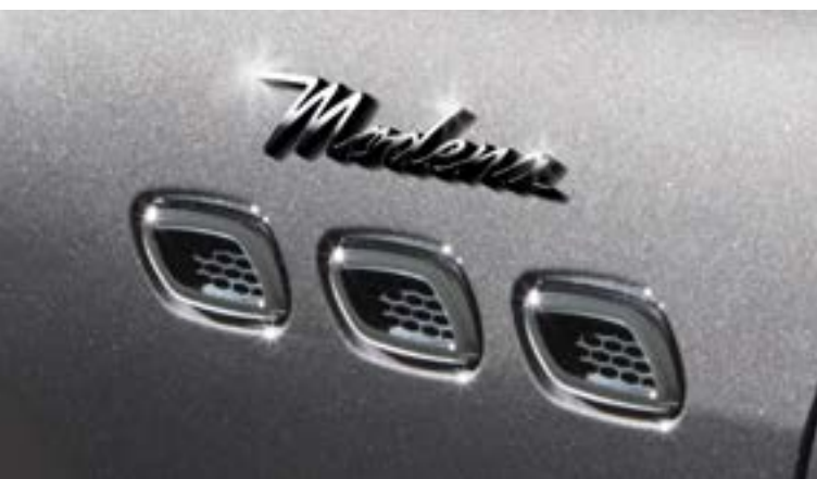
Levante - Prese d'aria laterali e stemma Modena