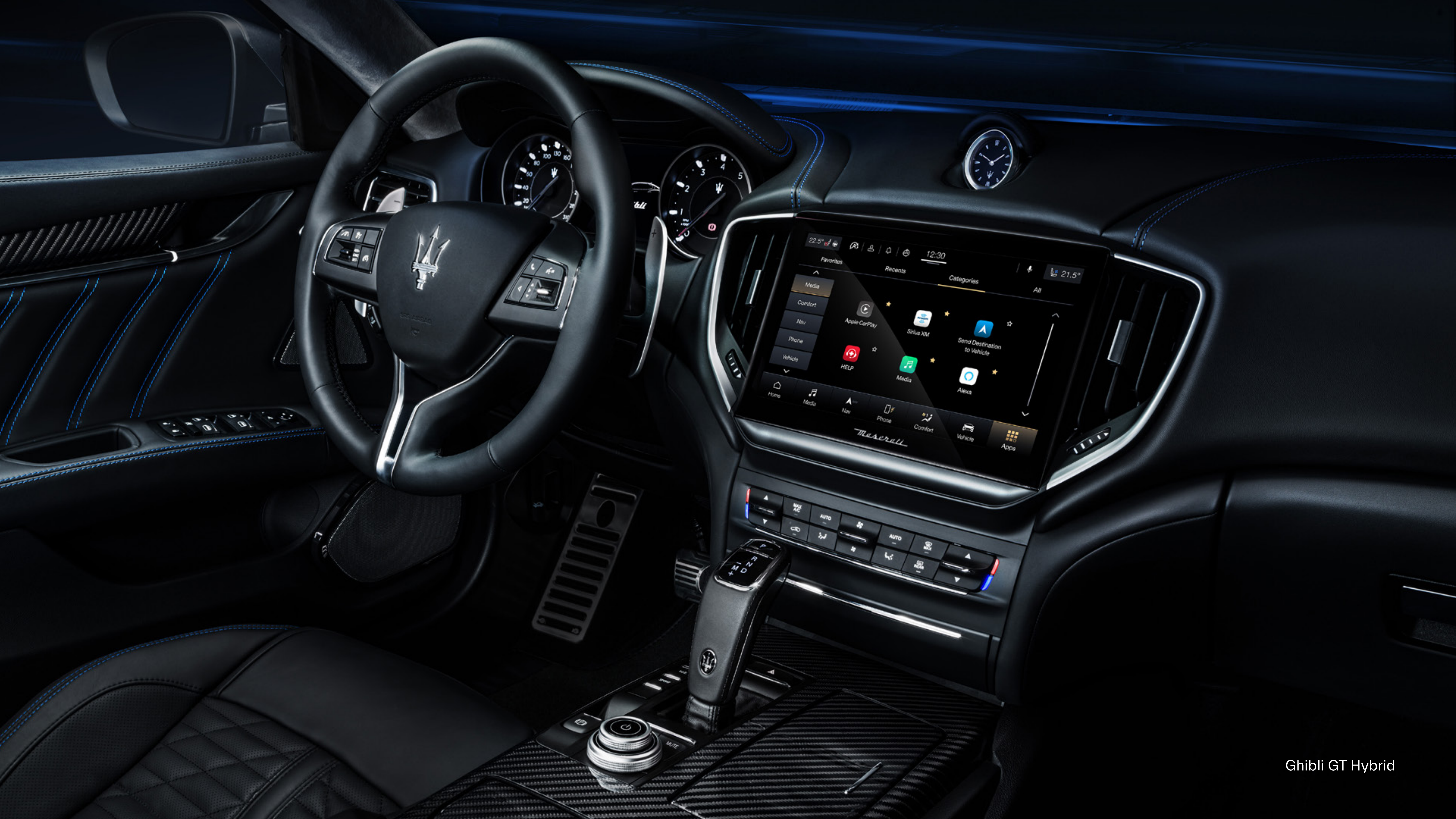
Ghibli GT Hybrid