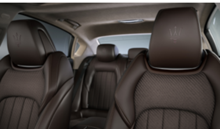
Quattroporte - Detalle del reposacabezas