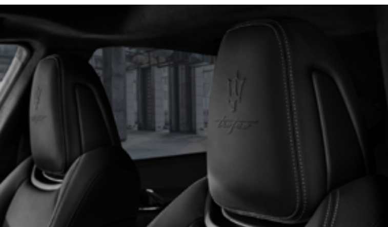
Quattroporte Trofeo - Detalle del reposacabezas