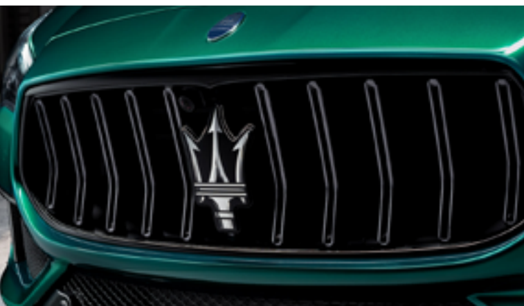
Quattroporte Trofeo - Rejilla