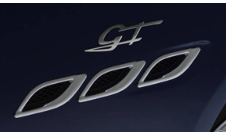
Quattroporte - Aperturas laterales y símbolo GT