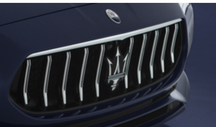
Quattroporte - Rejilla