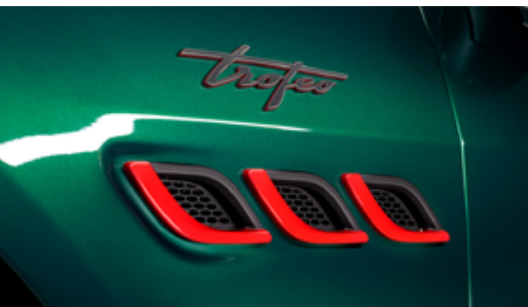
Quattroporte Trofeo - Aperturas laterales y símbolo Trofeo

Imponente en sus proporciones, atemporal en su diseño y distinguido por sus detalles derivados de las carreras sobre la elegante carrocería. Los elementos específicos de Trofeo como la fibra de carbono de alto brillo en las tomas de aire delanteras, traseras y laterales hasta los oscuros tubos de escape V8 a través de los faldones laterales negros te enfrentan con espíritu desmesurado. El Quattroporte Trofeo se ha creado para alcanzar el mayor rendimiento, llegando a una velocidad máxima de 326 km/h, llevándote de 0 a 100 km/h en solo 4,5 segundos con la extraordinaria potencia V8 de 580 caballos.