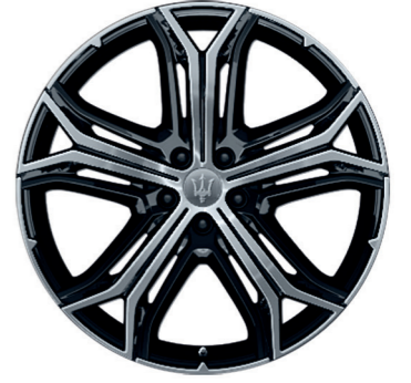
HELIOS (POLI À LA MACHINE)

Dimensions : 21" Avant : 265/40 R21 Arrière : 295/35 R21