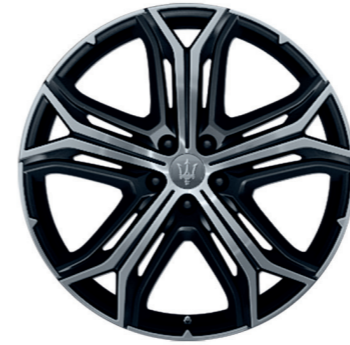
HELIOS (NOIR OPAQUE)

Dimensions : 21" Avant : 265/40 R21 Arrière : 295/35 R21