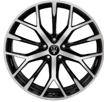
NOTO (ANTHRACITE AVEC COUPE DE DIAMANT D'ARGENT)

Dimensions : 20" Avant : 265/45 R20 Arrière : 295/40 R20