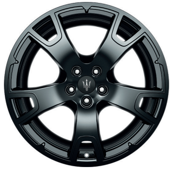
NEREO (MIRON FONCÉ)

Dimensions : 21" Avant : 265/40 R21 Arrière : 295/35 R21