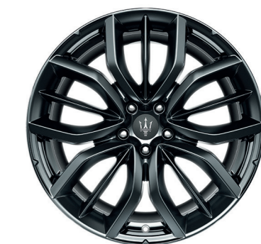
EFESTO (MIRON FONCÉ)

Dimensions : 20" Avant : 265/45 R20 Arrière : 295/40 R20