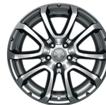
ZEFIRO (GRIS FONCÉ)

Dimensions : 18" Avant : 55/60 R18 Arrière : 255/60 R18