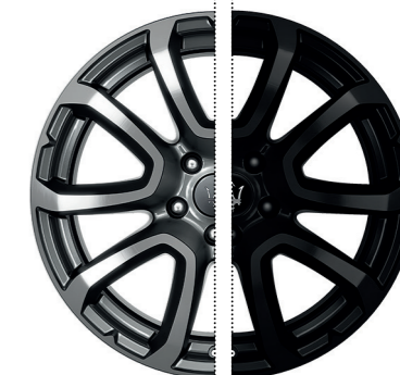
ZEFIRO (NOIR OPAQUE)

Dimensions : 19" Avant : 265/50 R19 Arrière : 295/45 R19