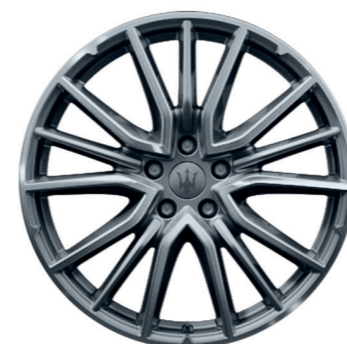
ARES (GRIS FONCÉ)

Dimensions : 19" Avant : 265/50 R19 Arrière : 295/45 R19