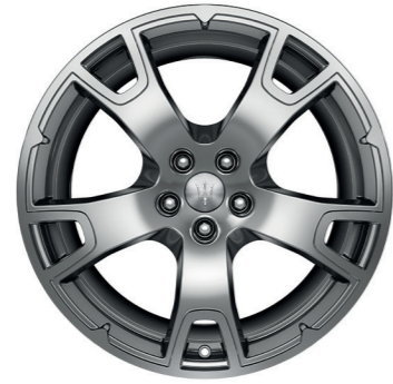
NEREO (GRIS BRILLANT)

Dimensions : 20" Avant : 265/45 R20 Arrière : 295/40 R20