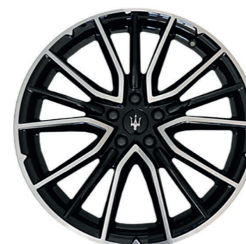
ARES (NOIR BRILLANT DIAMANTAGE)

Dimensions : 20" Avant : 265/45 R20 Arrière : 295/40 R20