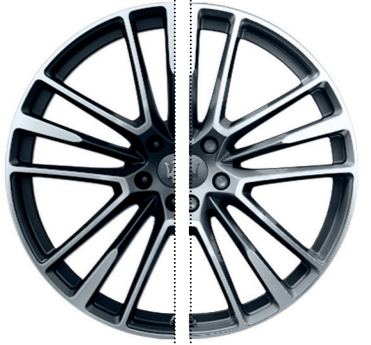
ORIONE (FORGÉ FINITION OPAQUE)

Dimensions : 22" Avant : 265/35 R22 Arrière : 295/30 R22