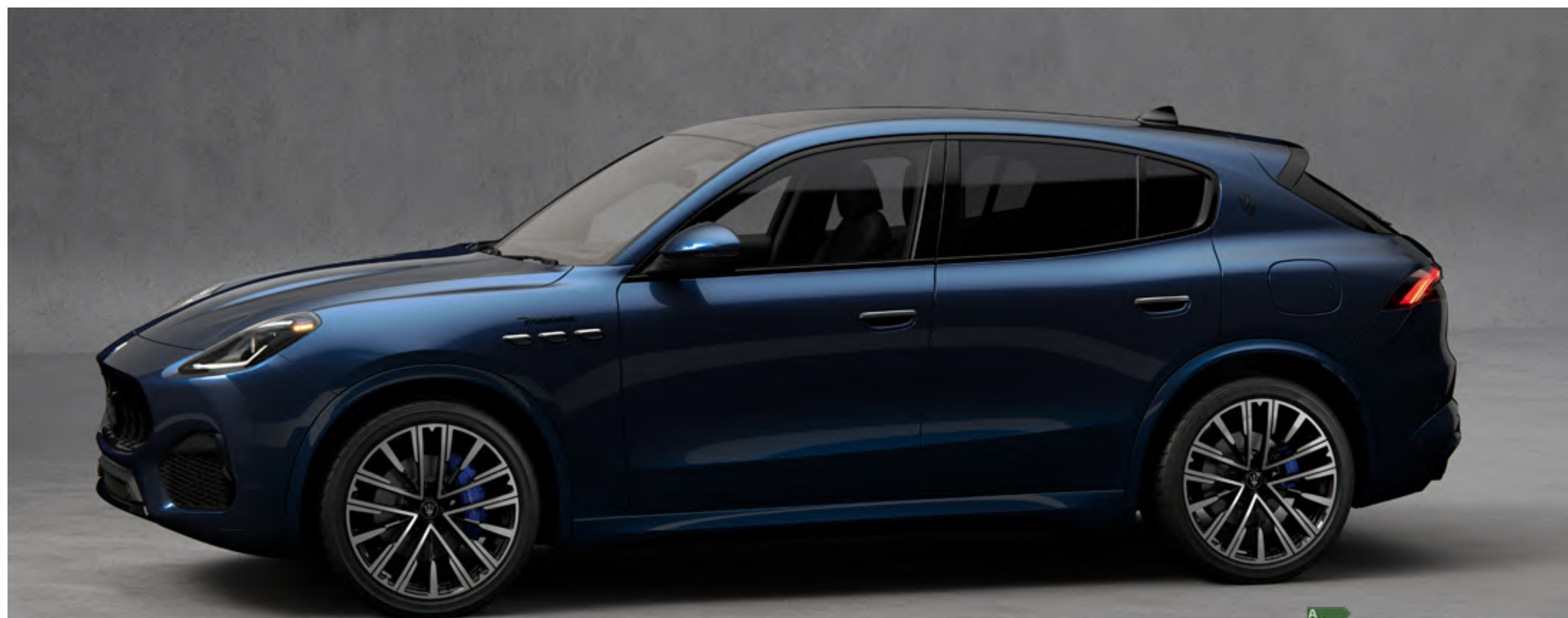
Grecale Modena PrimaSerie