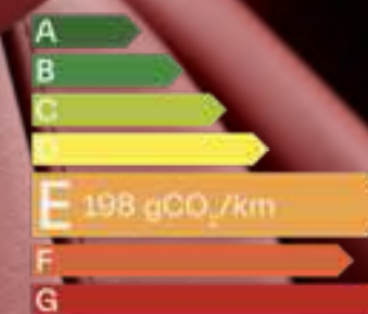
Grecale GT PrimaSerie

Le nouveau Grecale incarne l'audace toute italienne de Maserati visant à inscrire le luxe et la performance dans le quotidien. Le même esprit vous attend dans votre Grecale PrimaSerie.