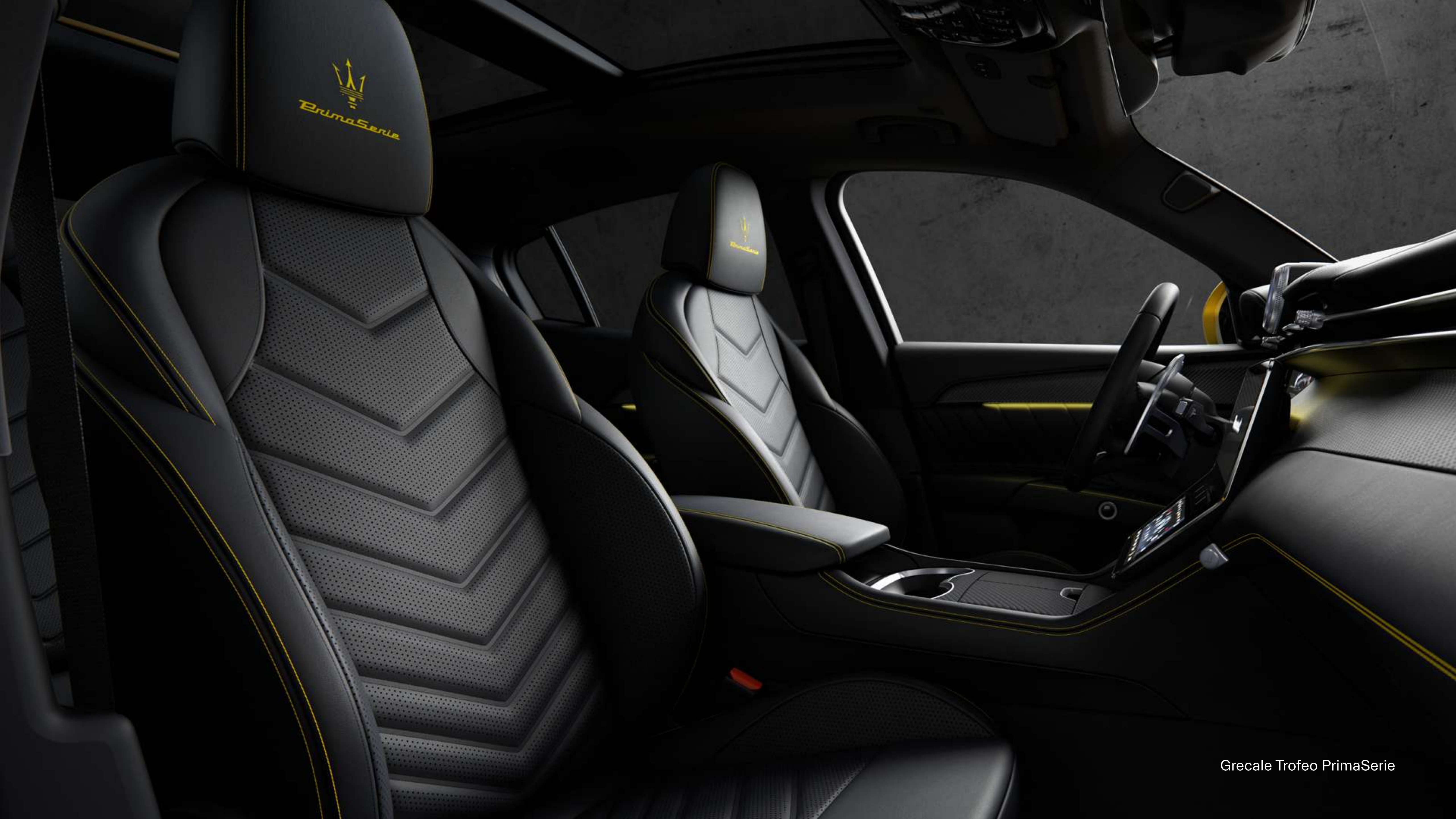
Grecale Trofeo PrimaSerie