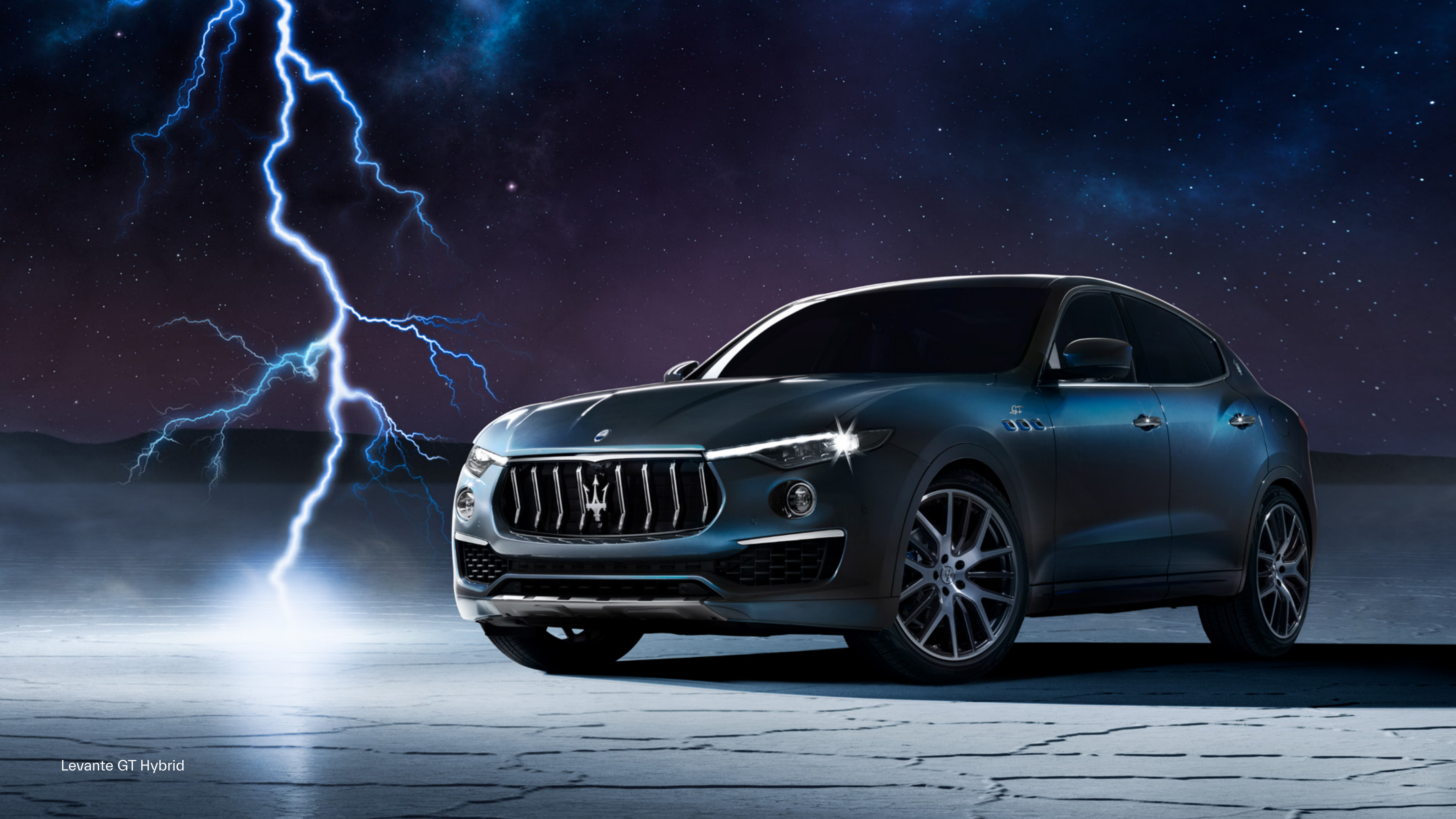
Levante GT Hybrid