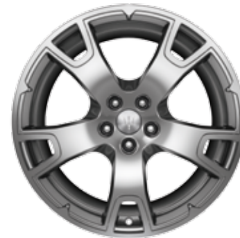
NEREO GRIS BRILLANT

Dimensions: 20" Avant: 265/45 R20 Arrière: 295/40 R20