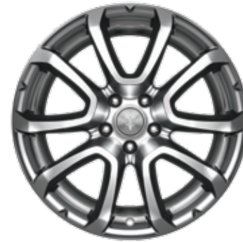
ZEFIRO GRIS FONCÉ

Dimensions: 19" Avant: 265/50 R19 Arrière: 295/45 R19