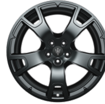
NEREO DARK MIRON

Dimensions: 19" Avant: 265/50 R19 Arrière: 295/45 R19