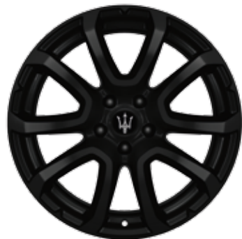
ZEFIRO NOIR OPAQUE*

Dimensions: 20" Avant: 255/45 R20 Arrière: 295/40 R20