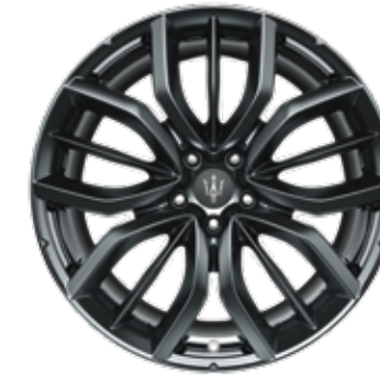
EFESTO DARK MIRON

Dimensions: 20" Avant: 265/45 R20 Arrière: 295/40 R20