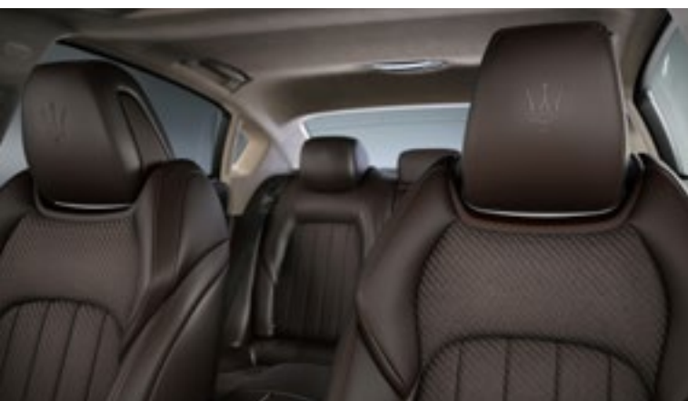
Quattroporte - Détail de l'appui-tête