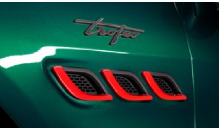
Quattroporte Trofeo - Ouïes latérales et badge Trofeo