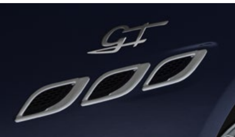
Quattroporte - Ouïes latérales et badge GT

Spécifications techniques de la version GT