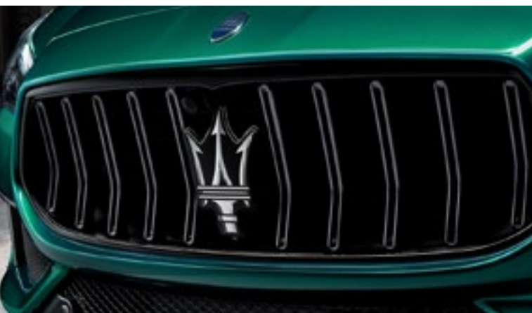
Quattroporte Trofeo - Calandre

La plus rapide, la plus raffinée. La Quattroporte est une icône puissante qui porte le grand tourisme de luxe à des niveaux de performance sans précédent. Pour ceux qui sont sur la voie rapide de l'exclusivité.