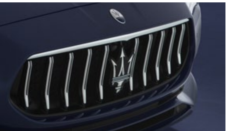
Quattroporte - Calandre