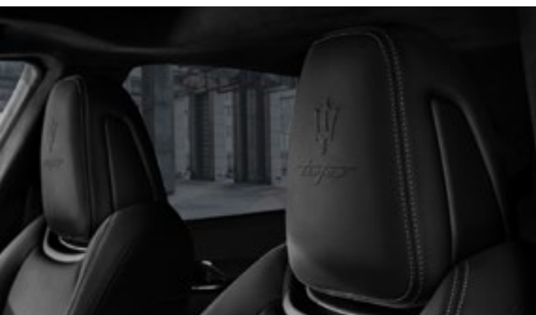
Quattroporte Trofeo - Détail de l'appui-tête