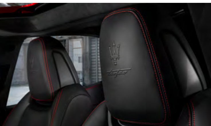
Ghibli Trofeo - Détail de l'appui-tête