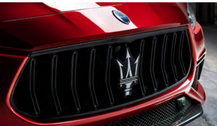
Ghibli Trofeo - Calandre