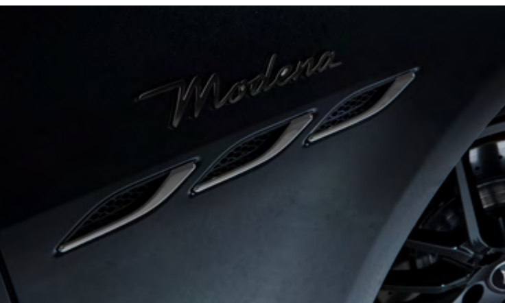
Ghibli - Ouïes latérales et badge Modena