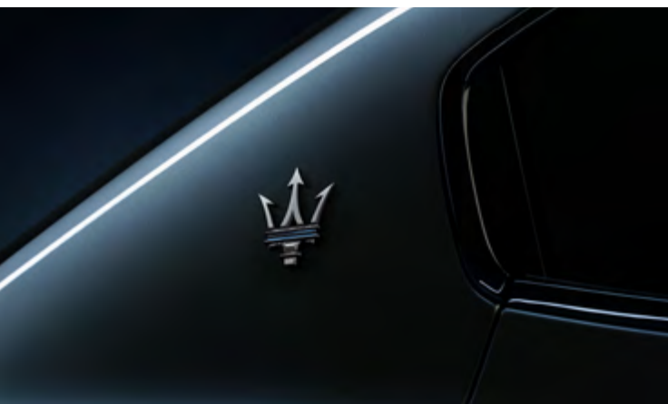
Ghibli GT Hybrid - Logo du Trident sur le pilier C