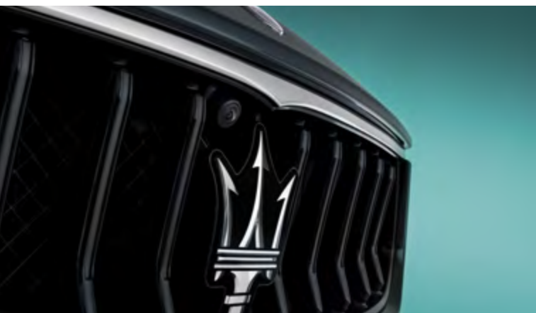
Ghibli - Calandre

Qu'importe votre choix et votre ambition, la Maserati Ghibli vous apportera toujours une réponse unique et inspirante.