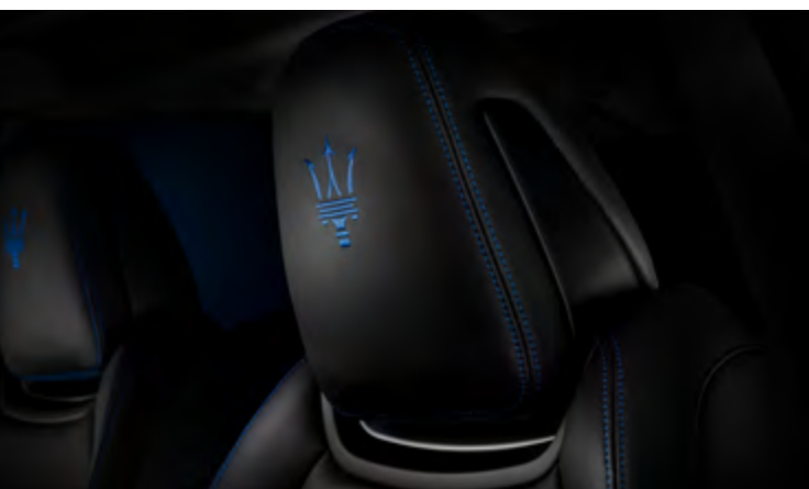
Ghibli GT Hybrid - Détail de l'appui-tête