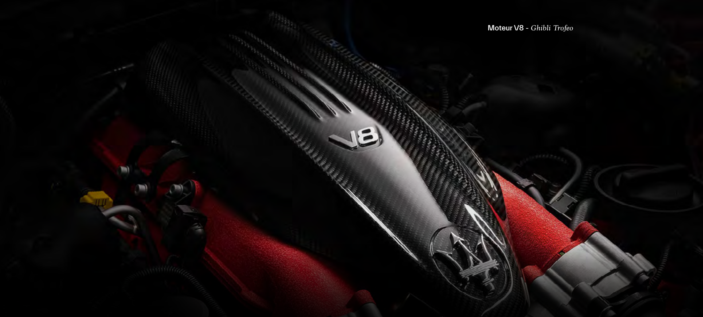
Moteur V8 - Ghibli Trofeo

L'une des caractéristiques essentielles de tous les véhicules Maserati est leur capacité à parcourir de longues distances à grande vitesse, avec dynamisme et raffinement.