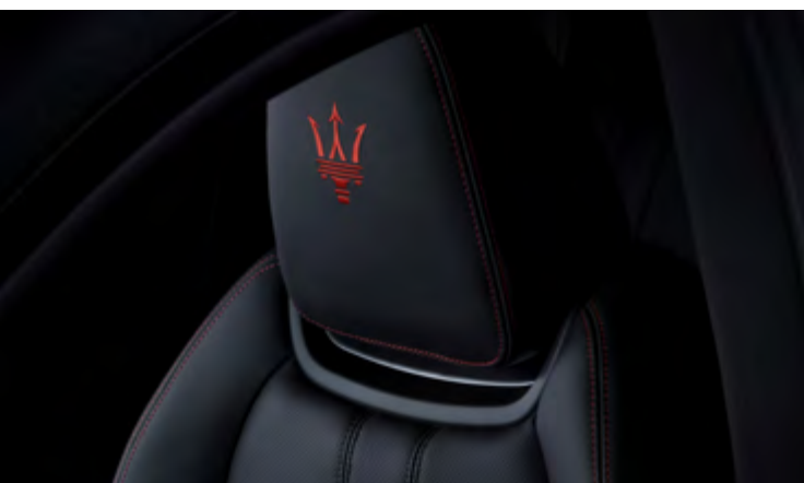
Ghibli - Détail de l'appui-tête