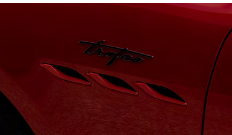
Ghibli Trofeo - Ouïes latérales et badge Trofeo

Vivez audacieusement. Conduisez avec caractère. Démarquez-vous en seulement 4,3 secondes avec l'ultime Maserati Ghibli Trofeo. Avec 580 ch et une vitesse de pointe de 326 km/h, la Ghibli Trofeo est la plus puissante jamais créée . Le champ des possibles prend une autre dimension. La ligne remarquable de la Ghibli, intensifiée par des éléments de design inspirés de la course. La fibre de carbone brillante à l'avant, à l'arrière et sur les ouïes latérales, ainsi que le capot Trofeo sculpté avec des extracteurs d'air vous donnent un avant-goût de ce qui vous attend lorsque vous prendrez le volant. C'est ainsi que la Ghibli Trofeo a vu le jour. Née de la compétition, améliorée par le confort et dotée d'un sens inné de la beauté intemporelle.