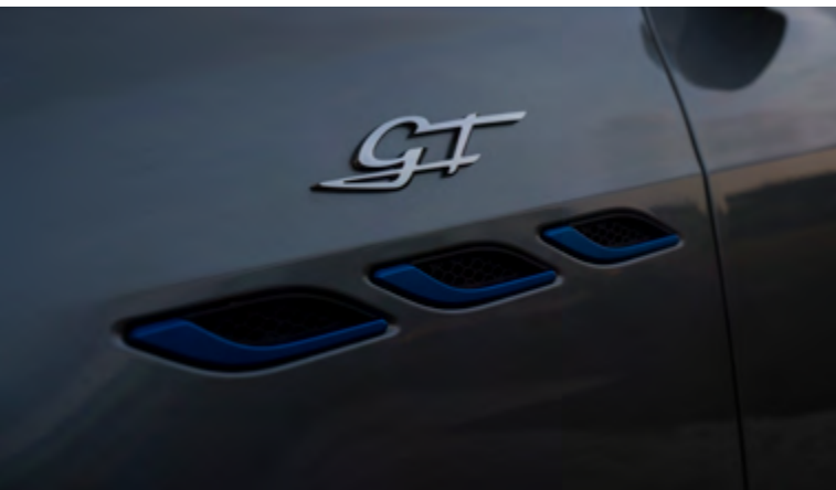
Ghibli GT Hybrid - Ouïes latérales et badge GT

Dans la nature, il y a des moments où une simple étincelle donne naissance à quelque chose de nouveau, un instant où l'hybridation agit comme un catalyseur de changement. C'est ce qui a inspiré la nouvelle Maserati Ghibli GT Hybrid : la première d'une lignée de nouveaux véhicules, à l'avant-garde d'une ère naissante pour la marque . La Ghibli GT Hybrid enflamme l'avenir de Maserati sans trahir le passé. Le premier moteur hybride dans l'histoire de la marque, où l'innovation et la technologie ont toujours été associées à une ingénierie automobile de haute performance, pour faire avancer Maserati vers un avenir plus durable. Plus rapide que le diesel, plus écologique que l'essence : la philosophie de la Ghibli GT Hybrid en quelques mots.