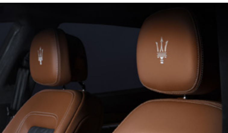
Quattroporte - Detalle del reposacabezas