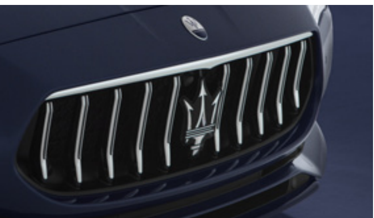
Quattroporte - Rejilla