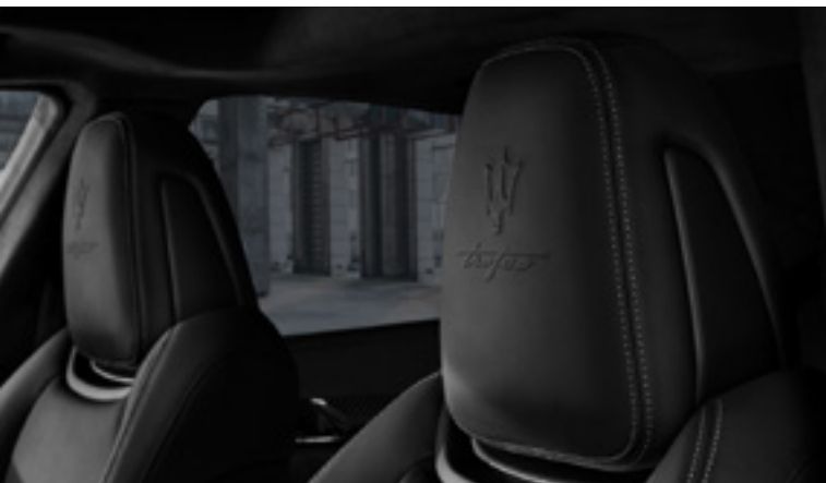
Quattroporte Trofeo - Detalle del reposacabezas