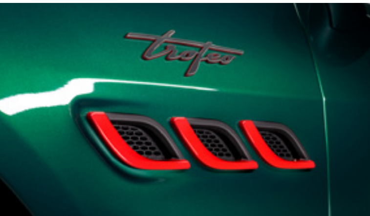
Quattroporte Trofeo - Aperturas laterales y símbolo Trofeo

Imponente en sus proporciones, atemporal en su diseño y distinguido por sus detalles derivados de las carreras sobre la elegante carrocería. Los elementos específicos de Trofeo como la fibra de carbono de alto brillo en las tomas de aire delanteras, traseras y laterales hasta los oscuros tubos de escape V8 a través de los faldones laterales negros te enfrentan con espíritu desmesurado. El Quattroporte Trofeo se ha creado para alcanzar el mayor rendimiento, llegando a una velocidad máxima de 326 km/h, llevándote de 0 a 100 km/h en solo 4,5 segundos con la extraordinaria potencia V8 de 580 caballos.